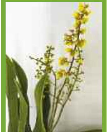
Alle Fotos vom 3.6.2020.