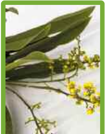
4 x Trichocentrum pumilum

Gern wird das Trichocentrum pumilum als Zwerg-Maultierorchidee bezeichnet. Dies hängt mit der Größe dieser Miniaturorchidee, aber wohl vor allem mit der Blütengröße zusammen. Letztere sind lediglich 3 bis 5 mm groß, bei unseren Pflanzen 2 bis 4 mm. Das Taxon wurde 1825 im 'Bot. Reg.' 11, Seite 920, von dem englischen Botaniker, Gärtner und Orchideeologen John LINDLEY FRS (5.2.1799-1.11.1865) als Oncidium pumilum erstbeschrieben. Im Jahr 2001 wurde die Species von dem britisch-US-amerikanischen Botaniker Mark Wayne CHASE (geb. 1951) und dem US-amerikanischen Botaniker Norris H. WILLIAMS (geb. 1943) in die Gattung Trichocentrum überführt, was von den beiden Autoren 2001 in der 'Lindleyana' 16, ab Seite 138, veröffentlicht wurde. Beim morphologischen Vergleich beispielsweise mit Trichocentrum oestlundianum können wir dieser Klassifizierung folgen. Auch die WCSP (= World Checklist of Selected Plant Families) der Kew Gardens akzeptiert diese Namensgebung. Somit stellt sich die Art taxonomisch wie nachstehend dar: Familie: Orchidaceae Unterfamilie: Epidendroideae Tribus: Cymbidieae Untertribus: Oncidiinae Gattung: Trichocentrum POEPP. & ENDL., 1836 Art: Trichocentrum pumilum (LINDL.) M. W. CHASE & N. H. WILLIAMS, 2001 >>