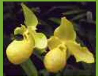
Paphiopedilum Golddollar ( primulinum × armeniacum )