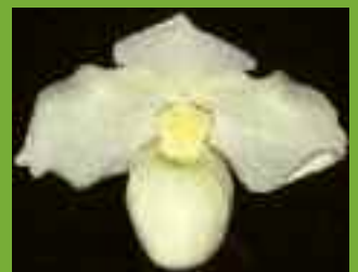
Paph. Wössner Vollmond ( armeniacum × niveum )