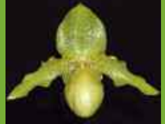
Paphiopedilum Hatsue Otsuka (Golddollar × rothschildianum )