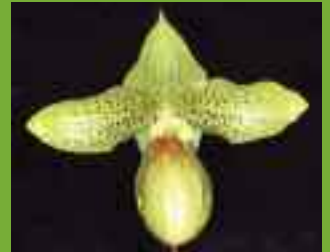
Paphiopedilum Doll Star ( sukhakulii × armeniacum )