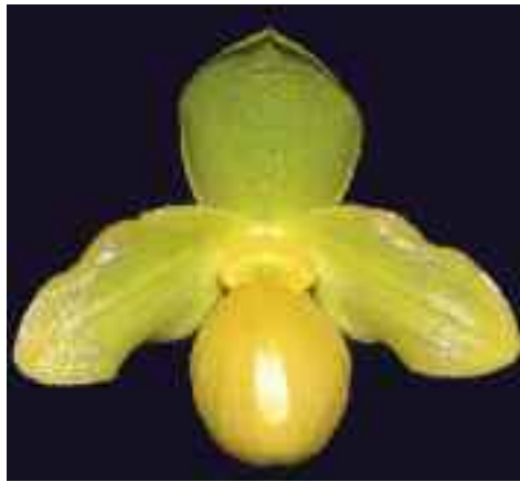
Paphiopedilum Golddollar ( primulinum × armeniacum )