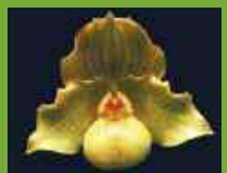
Paphiopedilum Golden Diamond ( armeniacum × fairrieianum )