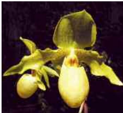
Paphiopedilum Hatsue Otsuka (Golddollar × rothschildianum )