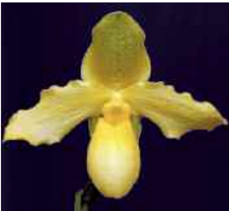
Paphiopedilum Duo de Citron (Golddollar × primulinum )