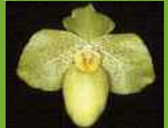
Paphiopedilum Fumi's Gold ( armeniacum × concolor ) 'Wössen'