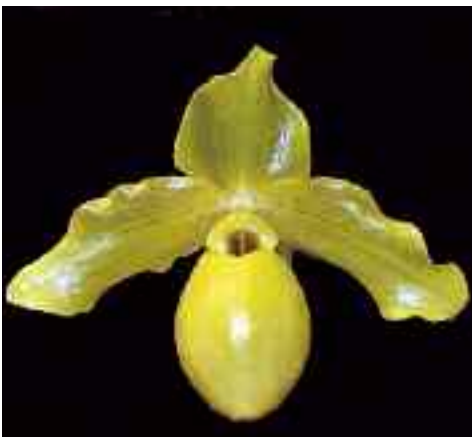
Paphiopedilum Senne Aurum (Golddollar × Pinocchio)