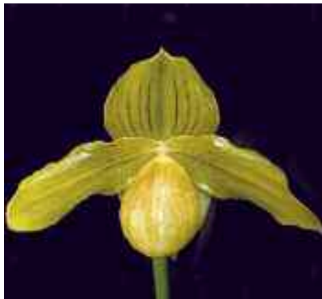
Paphiopedilum LSF Gold Standard (Golddollar × kolopakingii )