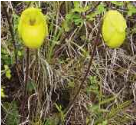
Paphiopedilum armeniacum am Standort.