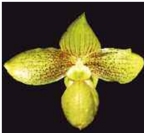
Paphiopedilum Doll Star ( sukhakulii × armeniacum )