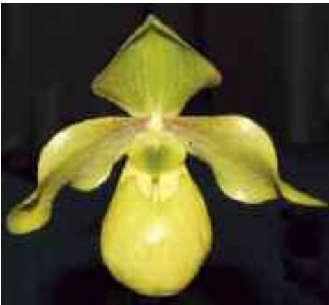
Paphiopedilum Wössner Golden Dollar (Golddollar × helenae )