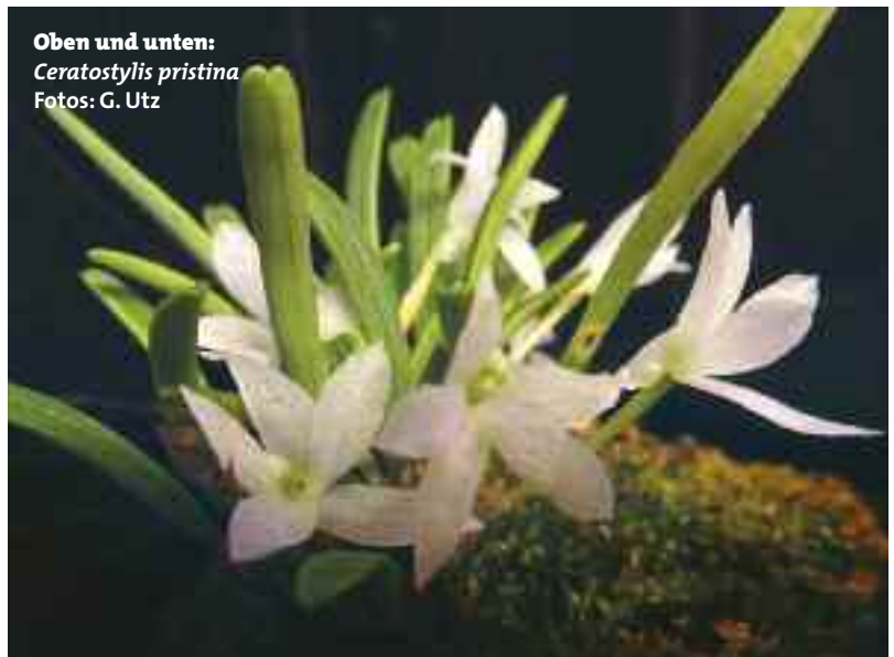
Oben und unten: Ceratostylis pristina

Die Orchidee wächst in einem Gebiet, das mit Primärwald oder moosigen, alten Bäumen bedeckt ist, in 1200 m Höhe an hell beleuchteten Standorten. Bukidnon zeichnet sich durch typisches, tropisches Regenwaldklima aus. Es ist normalerweise